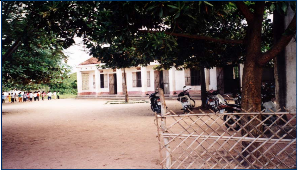
Trường THCS Bình Dân

Năm học 2003-2004 theo đúng kế hoạch, chương trình Giáo dục