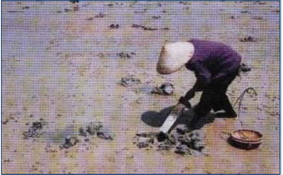
Đào bắt con sá sùng

Phương tiện bắt là một cái mai, ở dưới bằng sắt, có lưới mỏng, sắc để