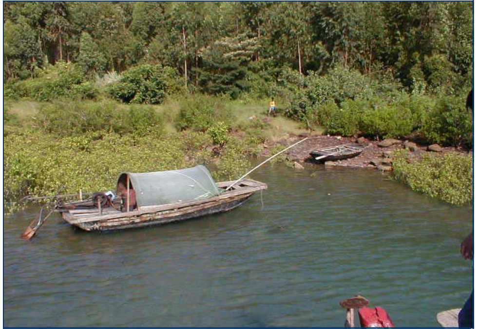
Đảo Ba Mùn

Theo đề án, đơn vị thuê môi trường rừng của Vườn quốc gia Bái Tử Long là Công ty TNHH Đinh Vàng. Công ty sẽ thuê môi trường để làm du lịch và trả một phần kinh phí cho cơ quan quản lý. Với nguồn thu này, đơn vị quản lý (Vườn Quốc gia Bái Tử Long) sẽ vạch kế hoạch chi tiêu cụ thể hàng năm cho công tác bảo vệ rừng, biển, bảo vệ tài nguyên của Vườn; kết hợp với các dự án giáo dục môi trường cho người dân địa phương. Các hình thức thông tin, quảng bá hình ảnh của vườn nhằm nâng cao nhận thức cho cộng đồng và du khách