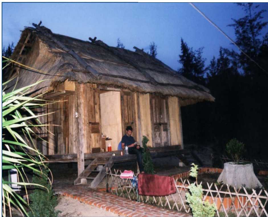
Khu du lịch sinh thái

manh, văn hoá xã hội nâng cao, an ninh quốc phòng ổn định là tiền đề chính cho sự phát triển toàn diện của nhân xã Quan Lạn nói riêng và cho toàn xã hội nói chung.