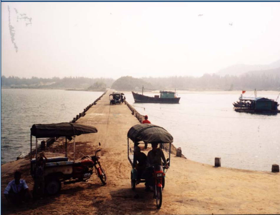
Bến cảng Quan Lạn