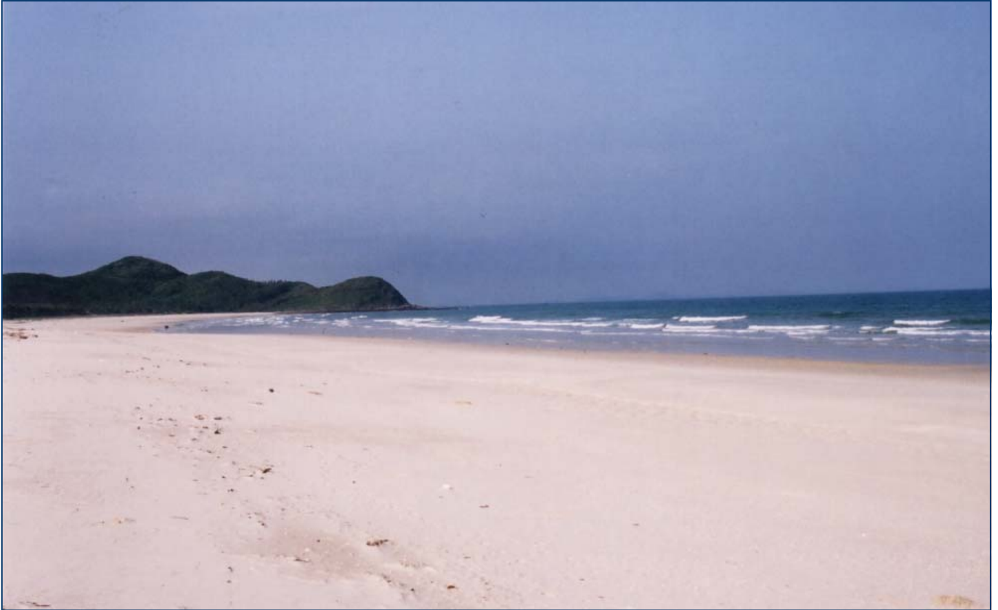
Bãi tắm Quan Lạn