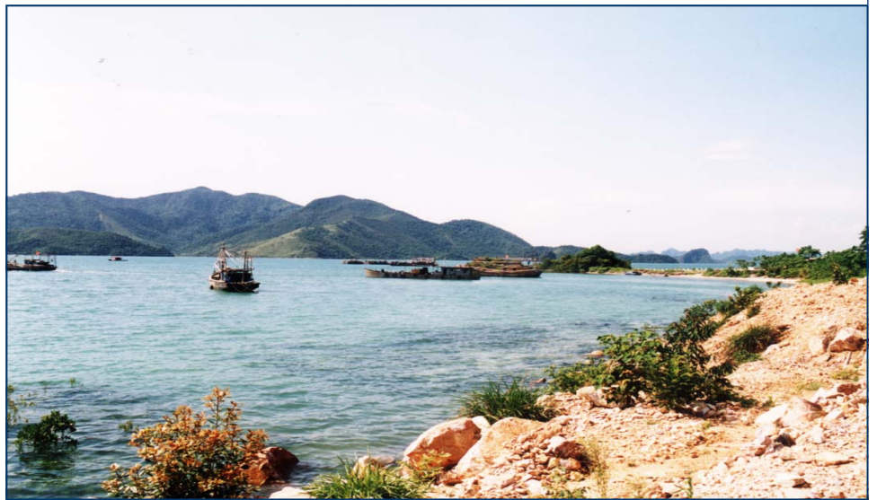
Khu vực cảng ở xã Minh Châu

Bản tin này là tập xuất bản thứ tư trong số các xuất bản hàng quý được phân phát trong phạm vi Vườn Quốc Gia và các xã vùng đệm. Mục tiêu của tập tin này là nhằm giúp cán bộ của Vườn Quốc Gia đưa thông tin một cách thường xuyên đến nhân dân trên Vịnh Bái Tử Long.