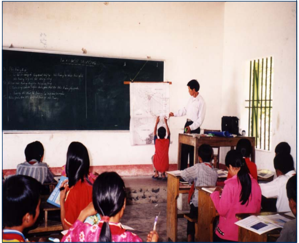
Tiết học Giáo dục môi trường ở Trường THCS Vạn Yên

Vân Đồn được trời phú cho một cảnh quan thiên nhiên tuyệt đẹp. Đó là bãi tắm Minh Châu, Quan Lạn, Ngọc Vũng cát trắng mịn, nước biển trong xanh, rừng phi lao thẳng tắp. Đó là khu du lịch Bãi dài đang được đầu tư xây dựng