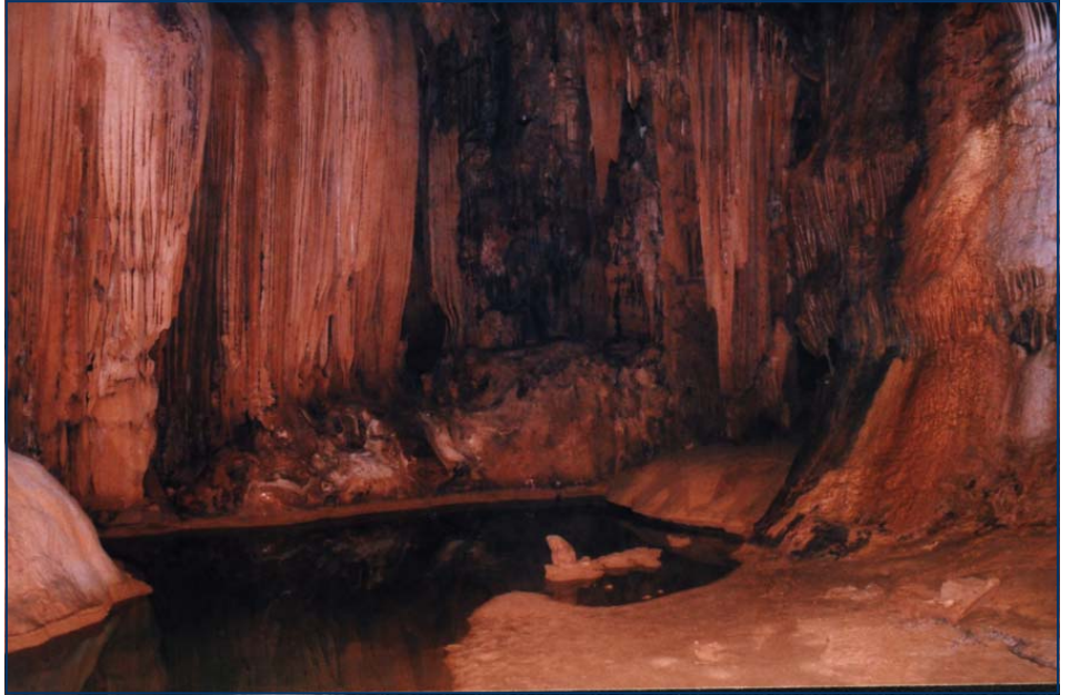
Hang Cô tiên ở Bản Sen

Các đại diện của Vườn Quốc gia Bái Tử Long, các xã Vạn Yên, Quan Lạn, Bản Sen và Minh Châu,