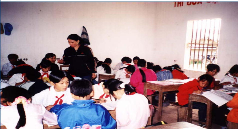
Thảo luận nhóm trong giờ GDMT ở trường THCS Đài Xuyên